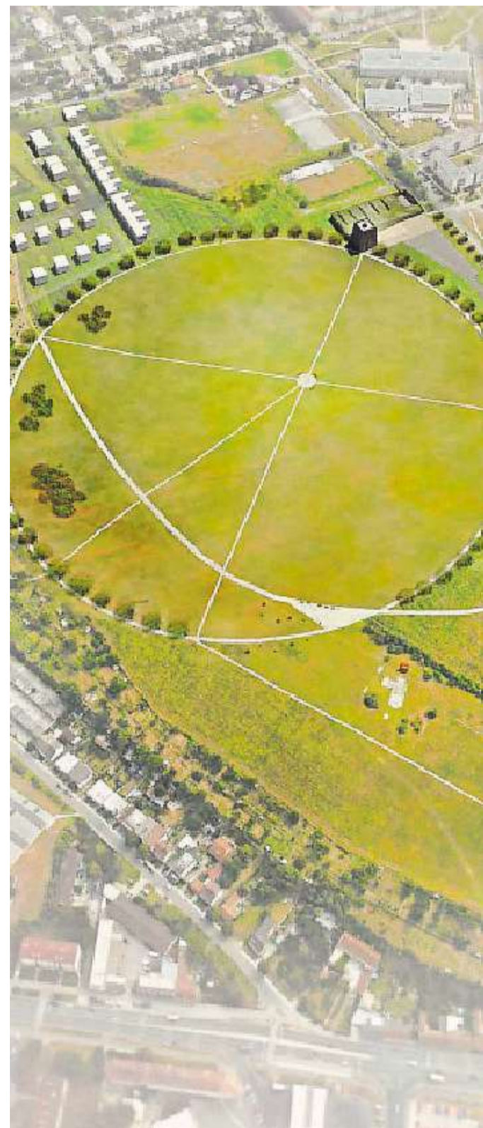
Budoucnost Na ploše asi 44 hektarů by mělo vzniknout klidné centrum ohraničené kruhovými stromořadím. V plánu je přírodní hřiště i muzeum. Radnice však nejdříve musí získat potřebné pozemky.