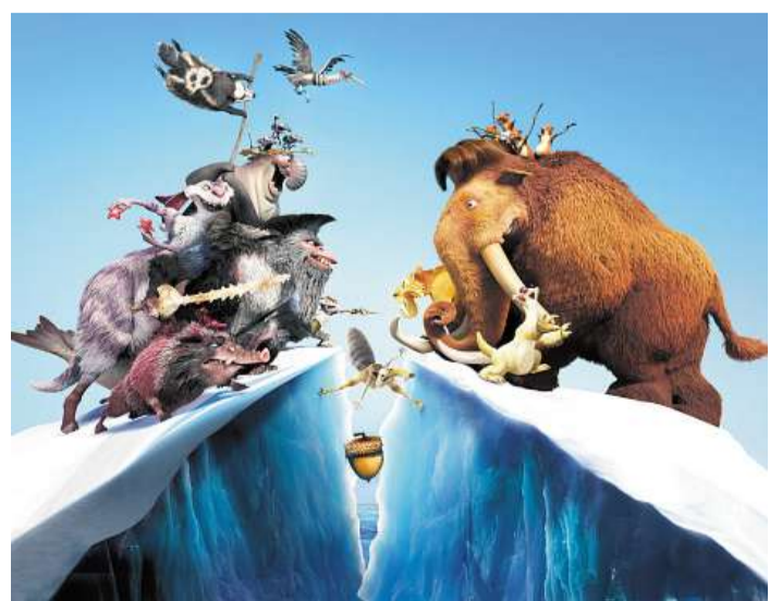
Doba ledová 4: Země v pohybu Oblíbená animovaná zvířátka potěší diváky všech věkových kategorií. Uvádí Cinema City.