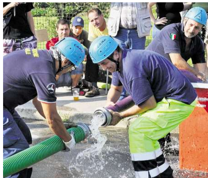
Jako při požáru Hasiči zorganizovali minulou neděli ve Střelčicích soutěž Turné čtyř osem aneb Osmacup.