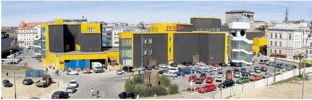
Zbouraný obchodák Zdemolovaný Hubáčkův obchodní dům Ještěd.