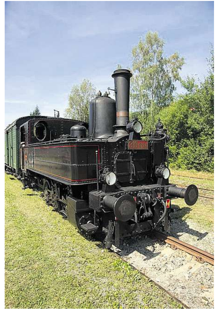
Vášim objektivem Čtenář MF DNES nafotil jízdu parní lokomotivu na zubačce na trati Kořenov - Harrachov, která se uskutečnila o víkendu.