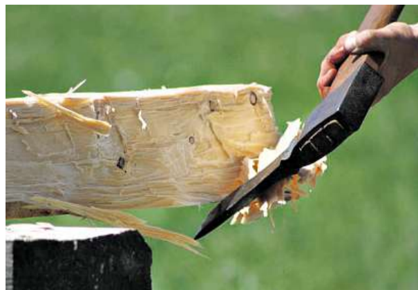
Sekera fest šumavské mistrovství v tesání trámů se odehrálo nedaleko Prachatic v Leptáci.

Vaším objektivem Zachytili jste zajímavou akci? Uložte své snímky na internetový server rajce.idnes.cz. Fotografie pravidelně uveřejňujeme v jihočeské příloze MF DNES