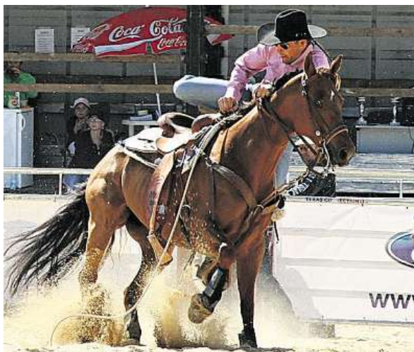
Jako na Divokém západě Součástí letošní výstavy Hobby na českobudějovickém výstavišti byla i soutěž v disciplínách rodea.

Zachytili jste zajímavou událost? Uložte své snímky na internetový server rajce.idnes.cz a také vaše fotografie se mohou objevit v jihočeské příloze MF DNES