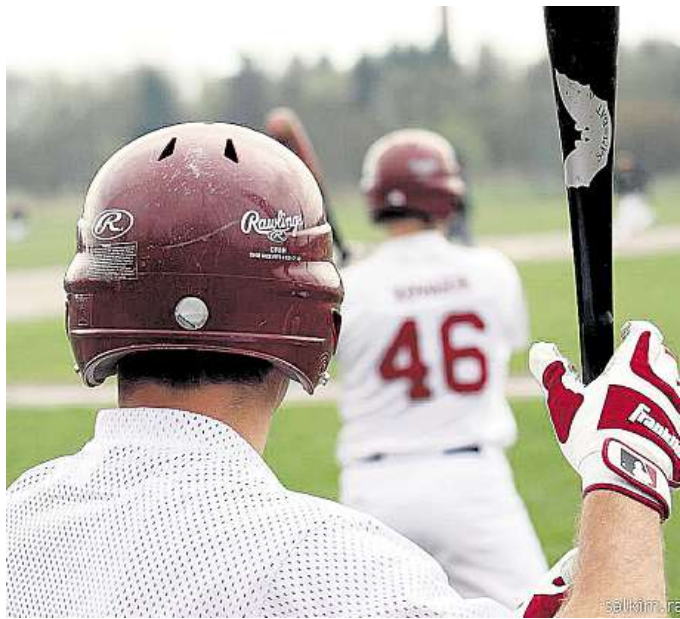
Čekání na nadhoz... Zvoláním rozhodčího „Hra!“ nadhozovač hodí míč proti pálkaři soupeře.