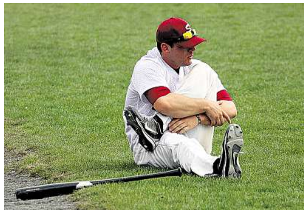
Odpočinek před odpalem Olomouc o víkendu sledovala utkání baseballové extraligy. Síly na metách poměřili Skokani Olomouc a brněnští Draci.