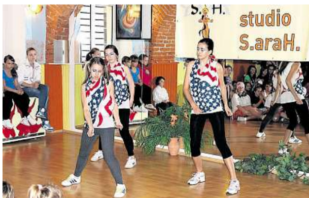
Tančící kobra Poslední březnový den se v Táboře uskutečnila klubová taneční soutěž.

Zachytily jste zajímavou událost? Uložte své snímky na internetový portál rajce.idnes.cz. Vybrané fotografie pravidelně zveřejňujeme v jihočeské příloze MF DNES