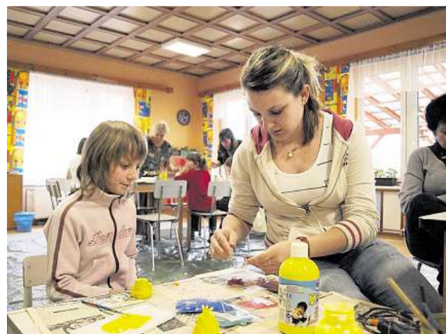
Velikonoční dílna Děti s rodiči se 31. března v Plavsku na Jindřichohradecku mohly přichystat na tradiční svátky.