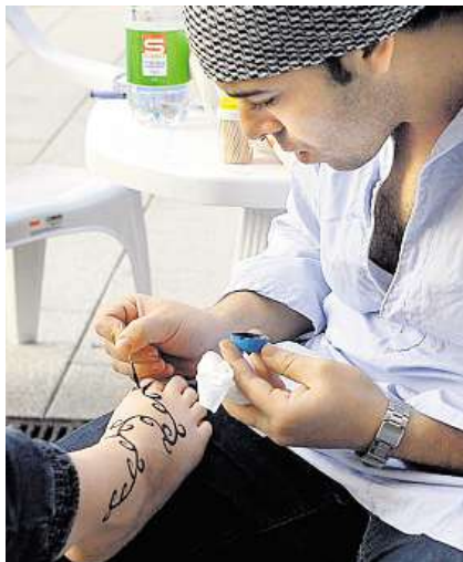
Arabfest. Festival arabské kultury s mottem Stopy (v) šafránu se uskutečnil minulý týden v Plzni.