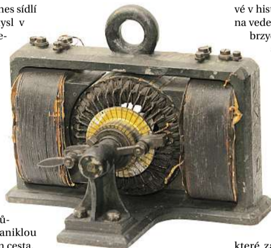
Unikát Muzeum vystavuje dynamo z roku 1866, které umělo rozsvítit žárovku s bambusovým vláknem.

elektrárna v budově, kde dnes sídlí okresní archiv. Ale průmysl v Trutnově bujel tak, že musela vzniknout v Poříčí velká tepelná elektrárna na černé uhlí ze Začleče, Svatoňovic, Radvanic. Skladišti popluku časem musela ustoupit obec Debrné. Nejdříve se poplěk vršil na hromady, ale z nich se prášilo, a tak vzniklo v Debrném poplčkové jezero. Kostelík z obce odstřelili při natáčení nějakého filmu z třicetileté války, z domů zůstaly jen podezdívky, zaniklou obec nyní připomíná už jen cesta. „Po vzniku Československa v roce 1918 elektrárnu obsadila německá menšina. Vytlačilo ji až československé vojsko. To se opakovalo také v roce 1938, poté spadala pod Elektrárny Berlín a byla popr-