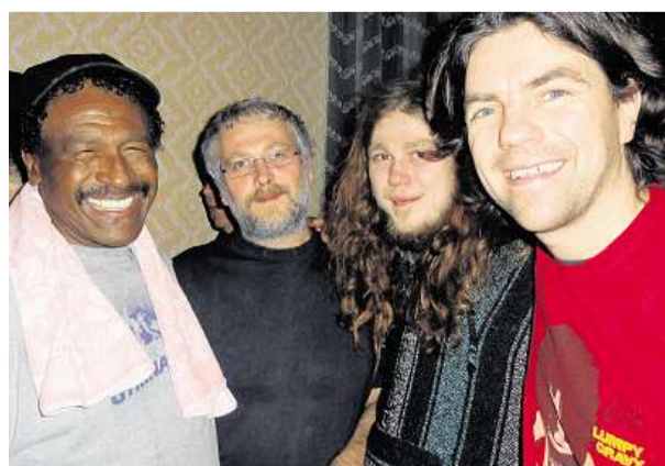
The Grande Mothers Fanoušci si po koncertu The Grande Mothers Re: Invented v Šonově nechali podepsat alba od Zappova saxofonisty Napoleona Murphy Brocka.