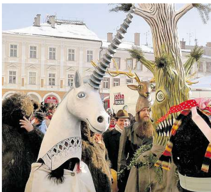
Trutnovský masopust Maškarní rej na Krkonošově náměstí.