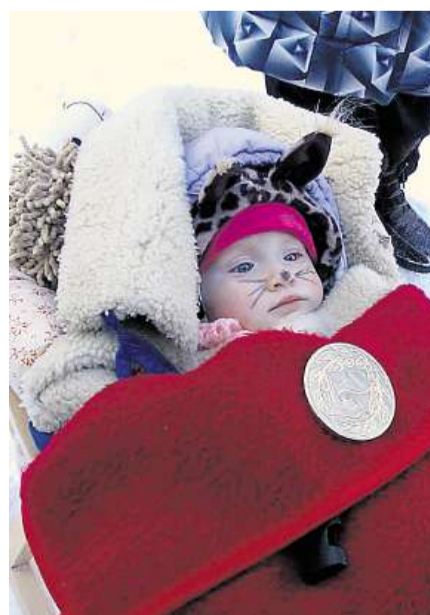
Superman Dětský masopust byl nedávno v Dolní Kalné.