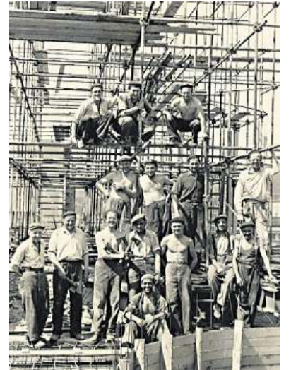
Už se kouří Elektrárna Poříčí I. vyráběla proud od začátku 20. století.