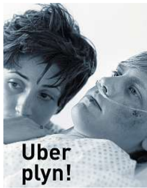
Takto vypadají plakáty dopravní kampaně.

kteřá se ze začátku zdá nadějná, zanedlouho sklouzne do průměru, nebo ještě níž. To je třeba případ projednávání územního plánu v Liberci. Dobrý nápad, zdánlivě vrcholně demokratický, se později přeměnil na vějíčku, s níž vedení liberecké radnice omámilo obyvatele míst, kde by měly stát v budoucnosti nové fabriky. Zpět k pochvalě. Liberecký kraj spustil od 1. března bezpečnostní kampani Uber plyn!, která by měla zabránit zvyšujícímu se počtu smrtelných dopravních nehod. Chvályhodné na tom je, že odbor dopravy Libereckého kraje nic draze ne-