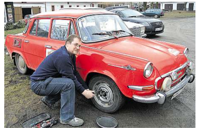
Kontrola Automobily musely mít platnou SPZ, zelenou kartu, technickou prohlídku a splňovat podmínky pro provoz na komunikacích.