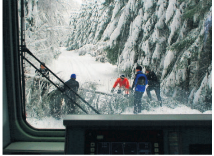
Pasažéři v akci Železničáři a cestující v akci - odklizení stromu ze železniční trati do Harrachova.

Liběna Stiebitzová Autorka text a fotografie publikovala na svém blogu na iDNES.cz http://stiebitzova.blog.idnes.cz/