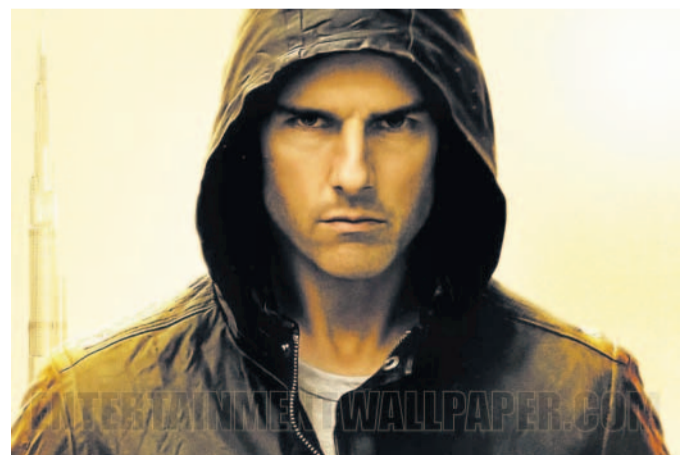
Mission Impossible Další pokračování úspěšné akční série s Tomem Cruisem, tentokrát s podtitulem Ghost Protocol.