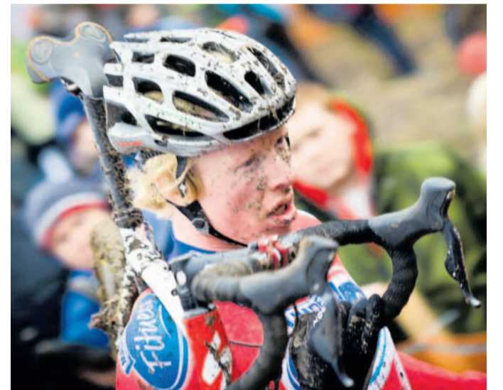
Práli se s blátem Cyklokrosovou elitu na uničovské trati o víkendu čekal bahňitý terén.