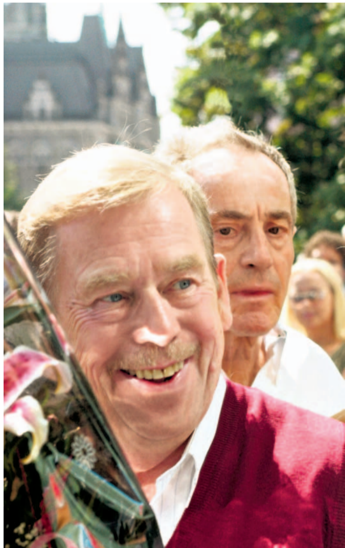
V Liberci po letech spolu Václav Havel se s Janem Tříškou po letech opět setkal v Liberci. Bylo to při vzpomínce na osmašedesátý rok, v srpnu roku 2003.

V roce 1968 vysílal liberecký rozhlas Havlovy komentáře. Četl je tehdy jeho kamarád, herec Jan Tříška