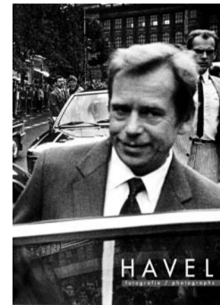
Přebal „liberecké“ knihy Havlových fotografií.