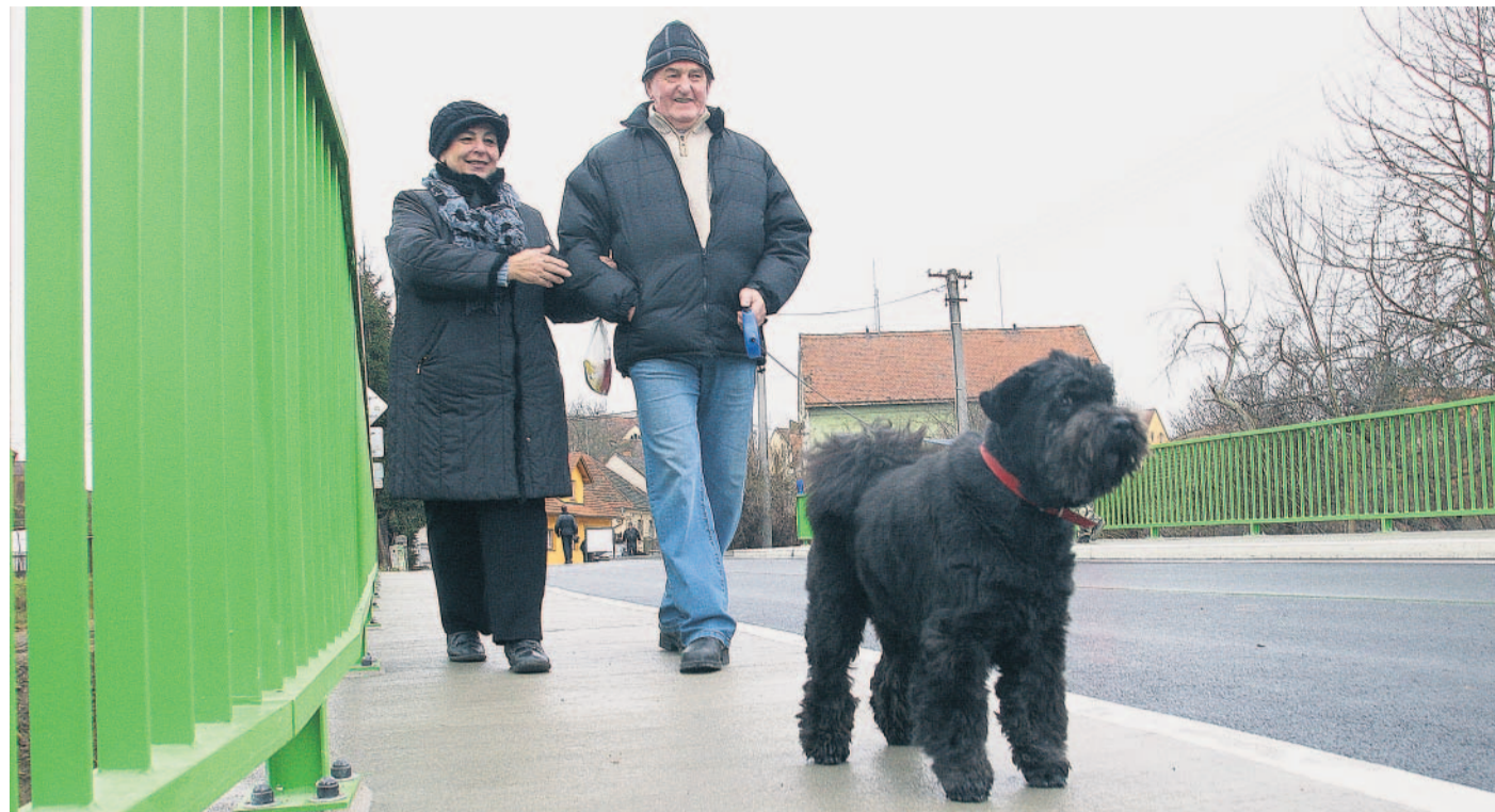
Nový most Obyvatelé Stodu na jižním Plzeňsku procházejí po novém mostě přes Merklínku.

D o Chrástu jsem se přestěhoval před pěti lety z Plzně a musím říct, že to pro mě byla pozitivní změna. V okolí je krásná příroda, teče tu Berounka, Klabava a jsou tu spousty lesů. Plzeň mi nechybí, pracovně se v ní pohybuji stále hodně, ale jsem rád, že z ní mohu odjet. Člověk si na klid zvykne hodně rychle. Snažím se se podpořit život v obci, která je jen kousek od Plzně. Lidé si stále více uvědomují, jak je důležitý občanský a spolkový život, že Chrást není jen noclehárna pro ty, kteří pracují v Plzni. Na druhou stranu Chrást není úplně tradiční vesnice. Má průmyslovou historii, k církevním věcem je spíše zdrženlivý. Snažíme se proto společně s občany Chrástu otevírat faru rozmanitým aktivitám a obnovovat křesťanské tradice - rozjíždíme například projekt centra setkávání s názvem Živá fara a na Štědrý den chystáme nejen pro chrástecké děti živý Betlém na farské zahradě.