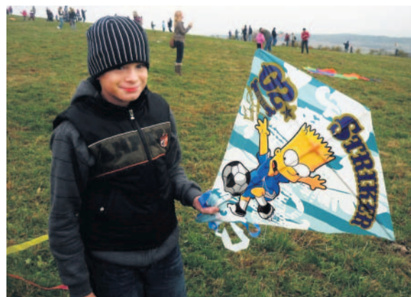
Drakiáda Populární podzimní akce se konala v Písku na kopci Bejčák 30. října.

Fotografie Heleny Kovařové umístěné na serveru rajce.net. Vyfotografujte kdykoli zajímavou akci a snímky uložte na server rajce.net. Vybrané fotky pravidelně zveřejňujeme.