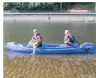
Zamykání Jizery na Malé Skále.