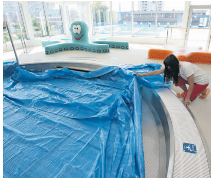
Plavání s chobotnicí V krytém plaveckém areálu v Přerově již dětem slouží třicet centimetrů hluboký bazének z nerezů.

„Kneippovým chodníkem jsme chtěli návštěvníkům zatraktivnit