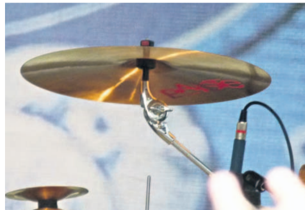
Festival s tradicí Víkend v Přerově patřil tradičnímu Zubrfestu na výstavišti. Kromě ochutnávky lidových pokrmů a piva se návštěvníci dočkali i hudebních vystoupení.

Tublatanka Pro návštěvníky v Přerově hrála Tublatanka a další kapely.