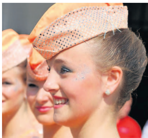
Mažoretky Na snímkách Jiřího Novotného se vracíme k víkendovým oslavám maršála Radeckého v Olomouci. Při nich mohli diváci obdivovat také přehlídku mažoretkových souborů. 2x foto: ricchie.rajce.idnes.cz

střechy udělal otvor a dostal se dovnitř. Z kůlny ukradl elektromotor za téměř tři tisíce korun. (dík)