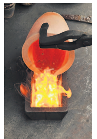
Finální opracování zlatého slitku v provozu společnosti Safina

Rostoucí ceny zlata prudce nezvyšují pouze poptávku po tomto drahém kovu, ale stále více Čechů nyní zlato také prodává, aby vydělali na jeho vysokých cenách. Například jablonecká společnost Safina, která se zlatem na tuzemském trhu obchoduje, v těchto dnech hlásí nárůst objemu vykoupeného zlata o desítky procent. Lidé, kteří ho nakoupili v minulosti, chtějí nyní zhodnotit svoje předešlé investice.