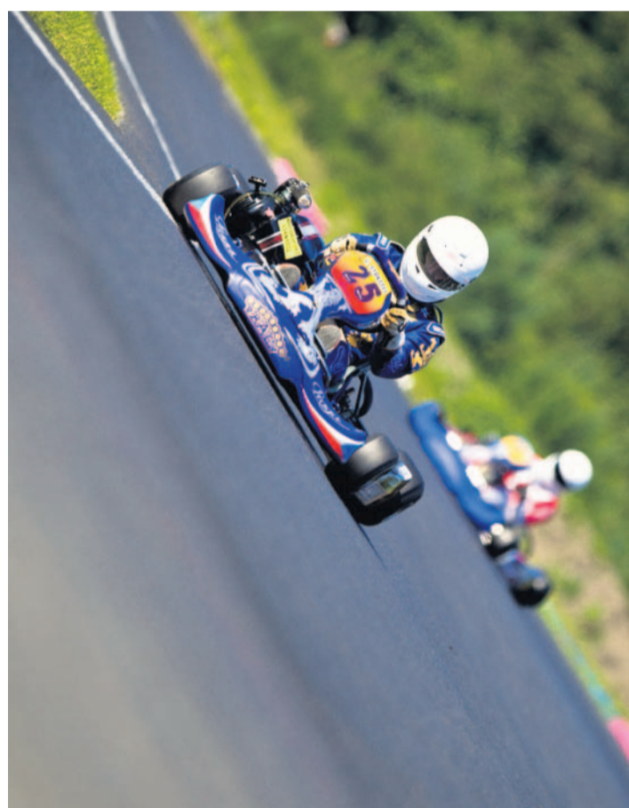
Minivozítka na okruhu Na okruhu v Sosnové na Českolipsku se o víkendu uskutečnil další závod domácího mistrovství republiky v kartingu.