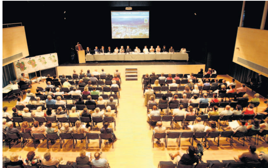
Bouřlivé jednání Ve středu večer dorazily do jabloneckého Eurocentra na projednávání územního plánu stovky lidí.

Zastupitel Otakar Kypťák také nesouhlasí s kruhovými křižovatkami. „Musí se dokončit silnice od libereckých Kunratic po ulici Palackého. Řešením nejsou kruhové ob-