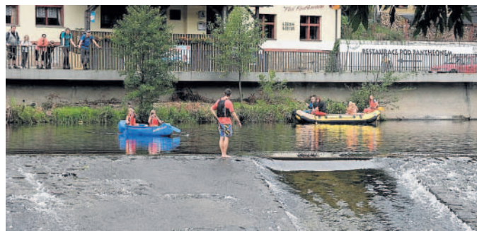
Výlet kolem Jizery Méně známá, turisticky zajímavá místa, například kostel ze 13. století v Nudovojovicích u Turnova, nabízí cyklostezka kolem Jizery z Malé Skály do Ploukonic.