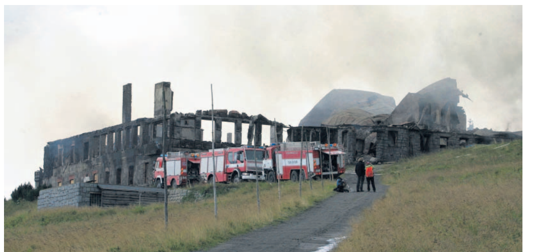
Co zde bude? Památkáři trvají na tom, aby na místě vznikla replika původního objektu.

uzavřená. Objekt v posledních letech poškodilo vlhko a vandalové. Podle některých odborníků stavbě hrozilo kvůli špatnému technickému stavu zřícení.