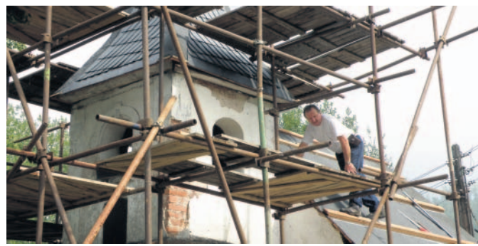
Nová střecha Kaplička právě včera dostala novou břidlicovou střechu, na řadě jsou vnější a vnitřní omítky.