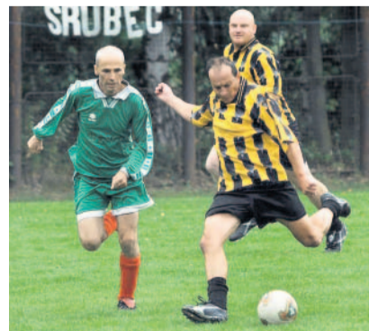
Fotbalový turnaj Ve Srubci se čtyři fotbalové týmy utkaly o pohár starostky.

Lukáš Kučera a Miloslav Kusbach nafotili sportovní akce na jihu Čech. Pokud chcete, aby se i vaše snímky objevily v MF DNES, uložte je na rajce.idnes.cz . Vybrané zveřejňujeme