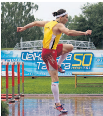
Velká cena Tábora propršela Atlety při extralize v Táboře trápil déšť.