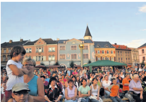
„Hodovali“ mladí i staří Svatovavřínecké hody na náměstí TGM v Přerově si o víkendu nenechaly ujít desítky návštěvníků. Město si připomnělo dobu kolem roku 1256.