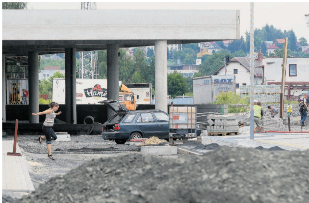
Stavba terminálu K vlakovému nádraží v Turnově se přestěhují všechny zastávky ze současného autobusového nádraží. Vzniká moderní dopravní terminál.

K vlakovému nádraží se přestěhují všechny zastávky ze současného autobusového nádraží Na Lukách. Cestující tak budou moci přestupovat z vlaků na autobus a naopak bez kilometrového přesunu. Nynější autobusové nádraží zůstane průjezdnou zastávkou.