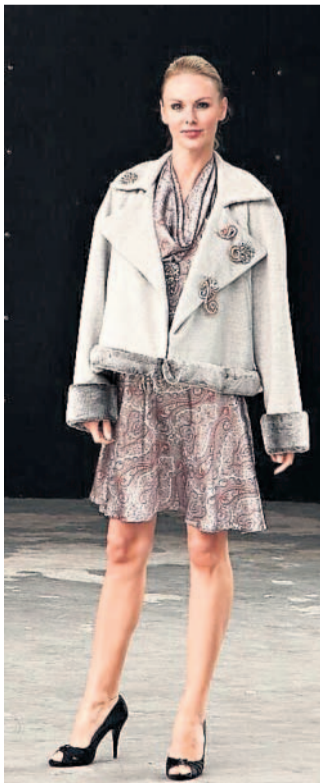
Krásné ženy Jablonec o víkendů patřil hlavně krásným ženám. 5x foto: Zbyněk Cincibus http://marcus.rajce.idnes.cz