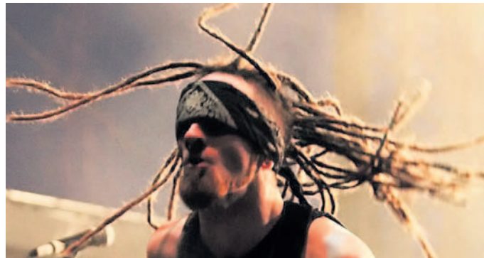
Mighty Sounds Český letní hudební festival zaměřený převážně na zahraniční hudbu ze žánrů punk, ska, reggae a dalších se konal od 15. do 17. července v areálu tábořského letiště Čápův dvůr.

Fotografie Václava Krále umístěné na internetovém serveru rajce.net. Vyfotografujte také kdykoli zajímavou akci a snímky uložte na server rajce.net. Vybrané fotografie v našem deníku pravidelně uveřejňujeme.