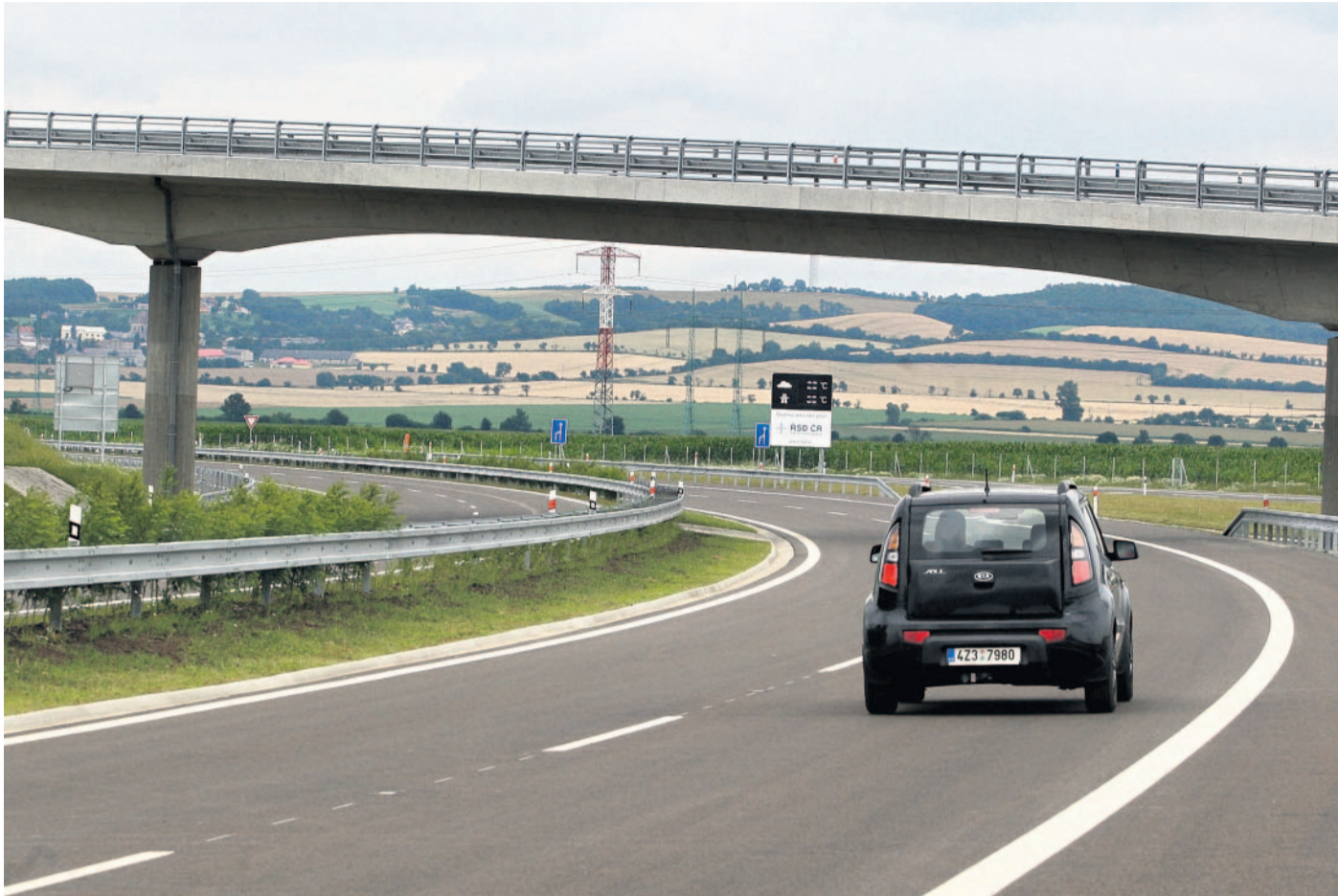
Zatím končí v Říkovcích Před týdnem byl slavnostně otevřený nový úsek dálnice D1 z Hulína do Říkovců.