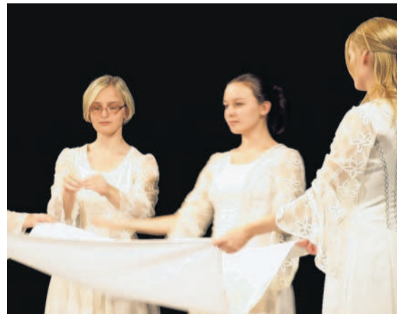
Ladnost i elegance V Némčicích nad Hanou se o víkendu konala přehlídka tanečních souborů ze ZUŠ Némčice nad Hanou.