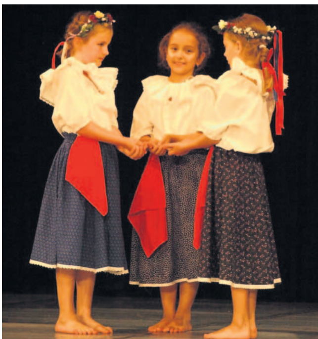
S věnečky a v krojích Na pódiu se kromě baletu vystřídaly i folklorní soubory a předvedly tradice.