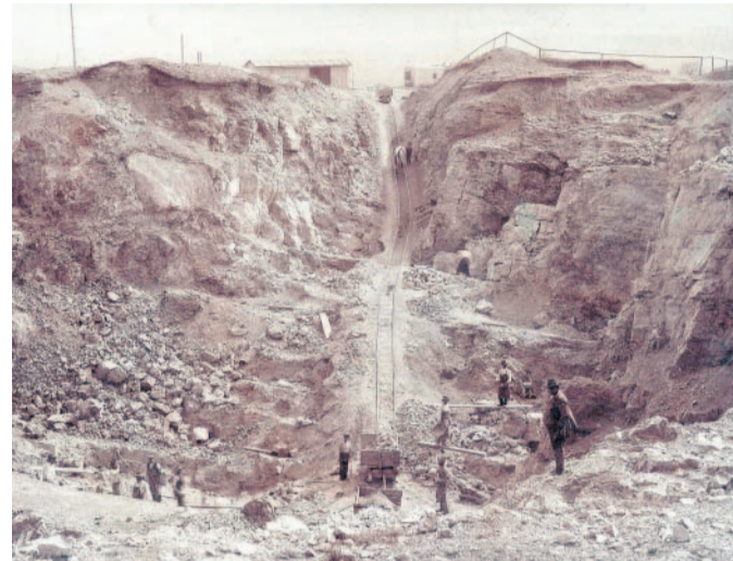
Státní lom v devonských vápencích v lomu u Čelechovic na Hané na Prostějovsku lze najít mnoho zkamenělin.

Devon na Prostějovsku tak reprezentují zkameněliny z okolí Čelechovic, řada exponátů je z mladších třetihor, třeba zkamenělé ústřice z Myslejovic. Stačí se zajímat. Michal Šverdik