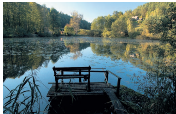
Kokořinsko Chráněná krajinná oblast by se měla v budoucnu rozšířit o další území.