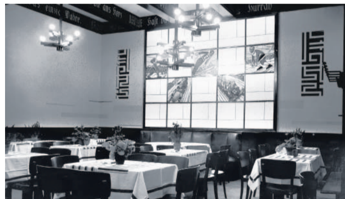
Dříve a dnes Proslulá restaurace Boccaccio byla oblíbeným cílem Jablonečanů (snímek vlevo). Dnes čeká marně na opravu.

Dnes novodobé, nepřilíhající vzhledné obložení skrývá řadu zajímavostí. Například malý zasedací sál byl vyzdoben orlicí s roztaženými křídly. „Za války ho přeměnili ve snákovou síň,“ připomněl Vobořil. Protože dnes budova není v dobrém stavu, hovoří se o její rekonstrukci již několik let. Na přestavbu by město potřebovalo necelých 600 milionů korun. Ty však nemá. Proto zatím jen vymění okna, propojí jednací síň a modernizují toalety. Lenka Brabencová