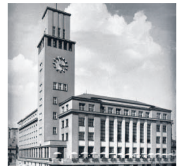
Stavba radnice Snímek vlevo ukazuje, jak se stavěla jablonecká radnice. Její funkcionalistická podoba se za osmdesát let nezměnila, kouzlo však ztratily interiéry.