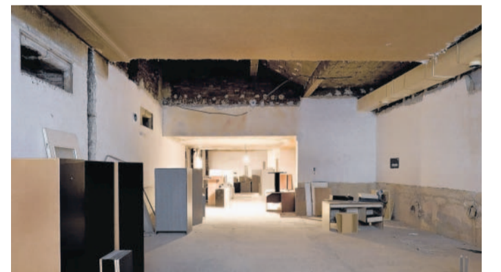
6x foto: Město Jablonec