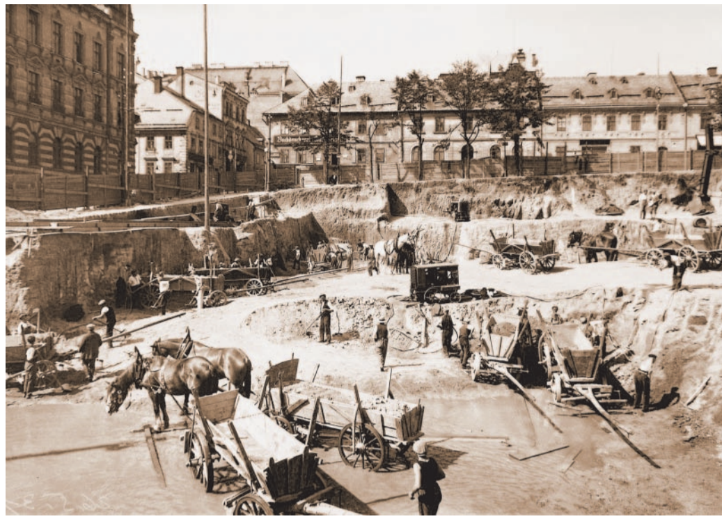
Začátek Ze 177 návrhů vybírali radní, jak bude vypadat radnice. K její stavbě došlo před osmdesáti lety.

Počet nezaměstnaných lidí v Desné v Jizerských horách za poslední měsíc klesl o sedm uchažečů. V horském městě tak zůstalo 194 lidí bez práce. V rámci Mikroregionu Tanvaldsko patří dlouhodobě Desná k městům s nejnižší nezaměstnaností. Zatímco například ve Smržovce je nezaměstnanost 12,6 procenta, v Desné je o dvě procenta nižší. Město se mimo jiné snaží ve spolupráci s jabloneckým úřadem práce pomoci lidem bez zaměstnání prostřednictvím dotovaných veřejně prospěšných prací a veřejné služby. (bra)