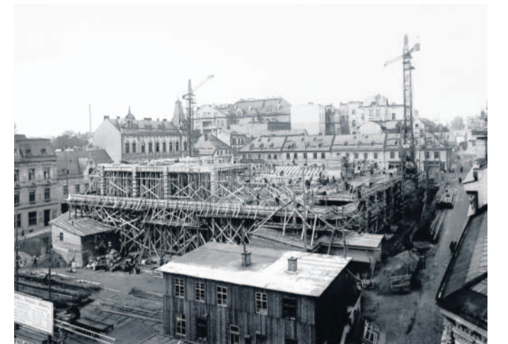
Pro lidi Radnici navrhl Karel Winter jako polyfunkční stavbu, která nebyla pouze sídlem radních, ale i společenským a kulturním centrem.

patřily k tomu nejcenějším, co budova ve svém vnitřku ukrývala,“ říká místostarosta.