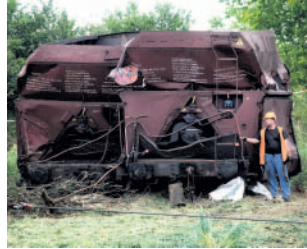
Pomačkané vagony Po nehodě vlaku u Topolan.

Abý toho nebylo málo, přišla včera inspekce se zprávou, že na trati byly zjištěny další závady. Její pracovníci zaznamenali uvolněné šrouby i mimo kritickou zatáčku, kde vykolejilo třináct vagonů.