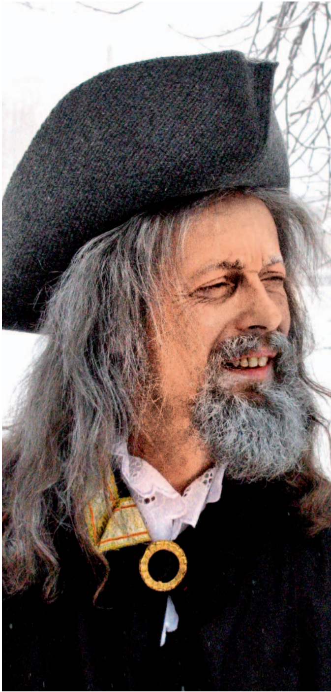
Kittel ve filmu O osudech vyhlášeného léčitele z Krásné vznikl před pár lety dokonce celovečerní film.