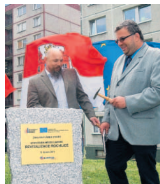
V Rochlicích včera slavnostně zahájili vylepšení sídliště.

podle původních odhadů 70 milionů korun, ve veřejné soutěži se podařilo cenu výrazně snížit. Zvítězila společnost Eurovia s nabídkovou cenou o 55 procent nižší. Úpravy se podle Stránské dočkají plochy o výměře téměř čtyř hektarů, opraveno bude 4 600 metrů čtverečních chodníků. „Rekonstrukce čeká sportovní a dětská hřiště s odpočívkami, kterých budou mít zdejším obyvatelům k dispozici 13,“ doplnila mluvčí radnice. Město se chystá vysadit na 130 stromů a 9 000 keřů. Sídlíště dostane i fontánu.