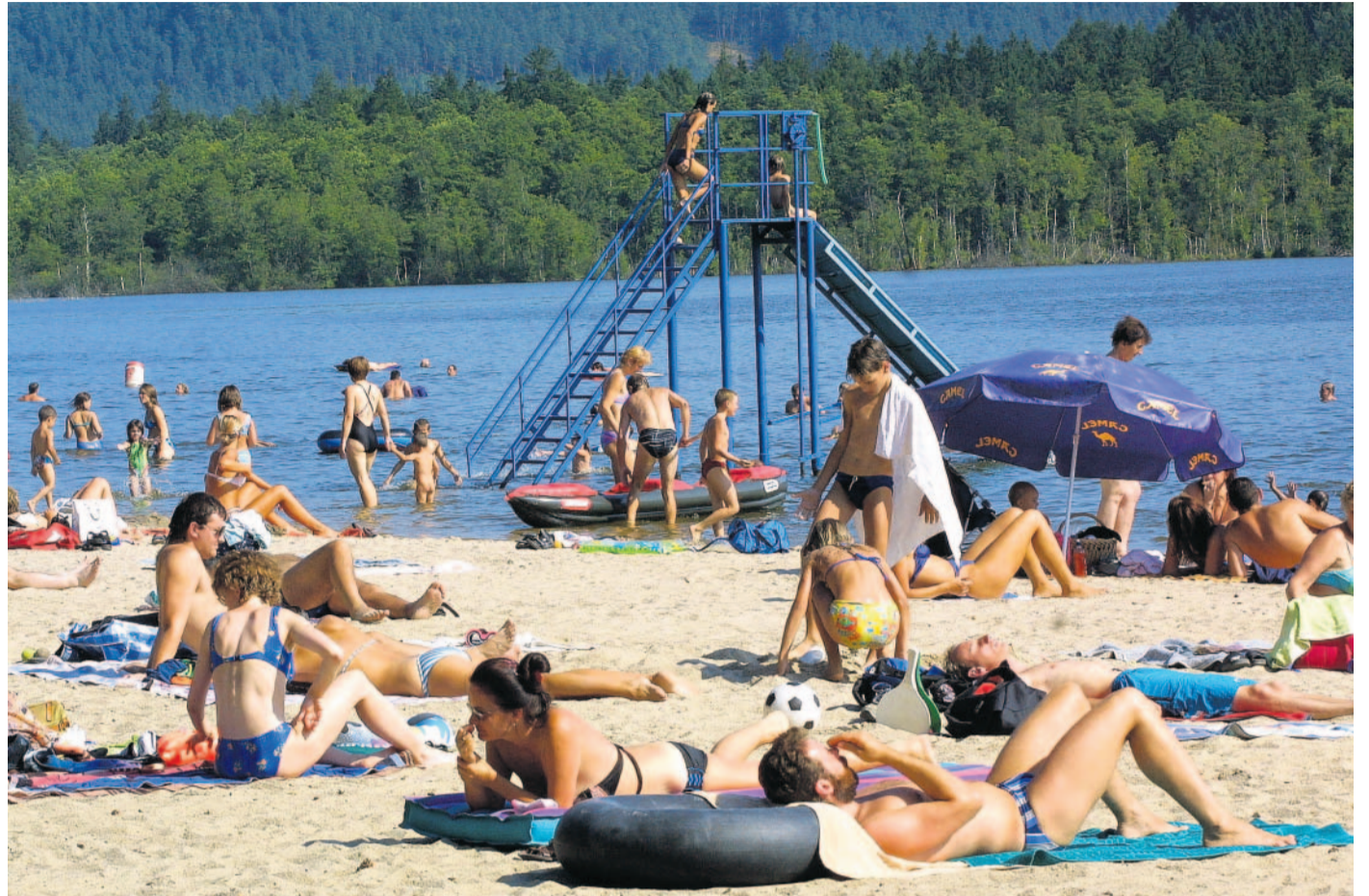
Oddech u vody Stane se Hamerské jezero opět vyhledávaným místem rekreatantů z Česka i z ciziny, tak jako to bylo kdysi?