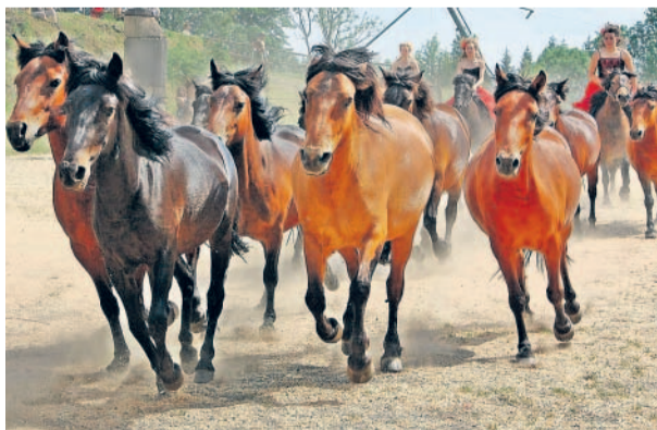
Na farmě Hucul na Janově hoře v Krkonoších se tak jako každoročně první červnový víkend konaly slavné křtiny.

Vášim objektivem MF DNES přináší čtenářské snímky z internetového fotoalba rajce.idnes.cz. Dnes jde o záběry ze křtin na farmě huculů