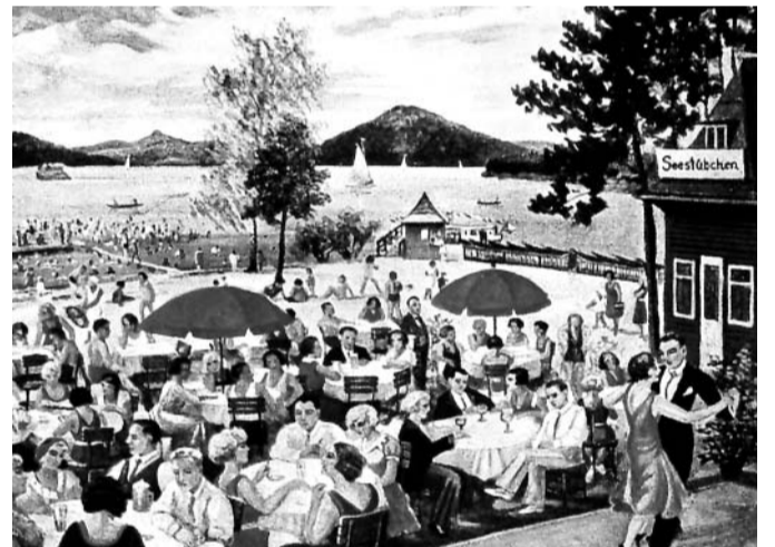
Staré zlaté časy Před staletím mířily na Hamr proudy turistů, kteří se tu ubytovávali v takzvaných letních bytch.

Po provedení oprav touto technologií bude radnice obnovené úseky v průběhu jednoho roku sledovat. Pokud se ukáže, že je tento způsob dostatečně kvalitní, využije napřesrok město této technologie v daleko větším rozsahu.