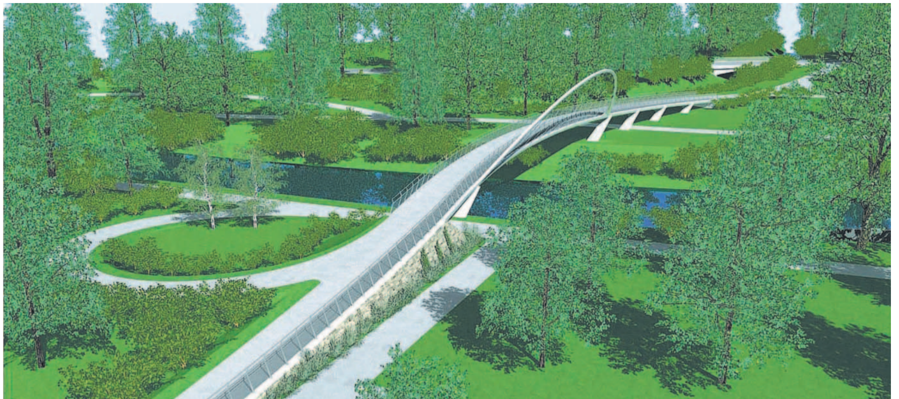
Přes Olši Nový most by měl v Českém Těšíně sloužit pěším a cyklistům, letos na podzim už by měl být hotový.