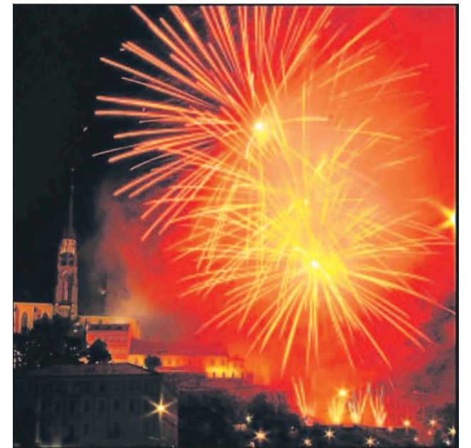
Prelude pod Petrovem V pátek osvítil město první ohňostroj, Metamorfózy od Teatrum Pyroboli.