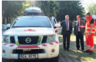
Stál milion Do terénního nissanu se vejde až sedm lidí.

Do terénního nissanu se vejde s potřebným zdravotnickým vybavením až sedm lidí. Auto stálo jeden milion, celý ho zaplatil dar Nadace