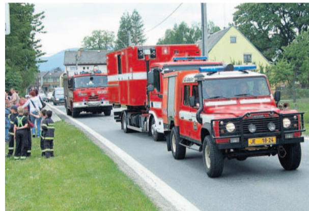
V plné parádě V České Vsi se o uplynulém víkendu slavilo sto dvacáté výročí založení místního Sboru dobrovolných hasičů. Nechyběla ani přehlídka hasičských vozů.