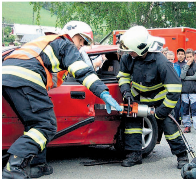
Hasiči v akci Náviku zásahu jednotek u požáru přihlíželi malí i velcí diváci.

Náročná práce Co vše je potřeba zvládnout a jaké to stojí úsilí. I to bylo při hasičských oslavách na programu dne.