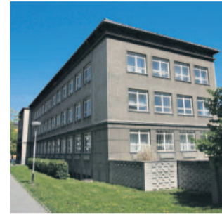
Budova Chemoprojektu v Přerově

Před pár lety měla budova Chemoprojektu uvolnit místo supermarketu , radnice to však nedopustila. Teď ale neví, co s prodělečným objektem dál, nemá peníze ani na jeho opravu. Zvažuje, že Chemoprojekt prodá.