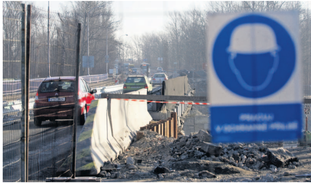
Zatím průjezdný Už brzy bude most uzavřen, řidiči se musí připravit na objíždky.

Karvinská sídlische Ráj a Hranice se dočkají regenerace na přání – projektanti do plánů zahrnuli výsledky ankety mezi obyvateli, v nichž odpovídali na to, co se jim líbí a nelíbí v místě jejich bydliště. Lidé se nyní dočkají vylepšení veřejného prostoru. Město s realizací počítá v letech 2012-14. (btk)