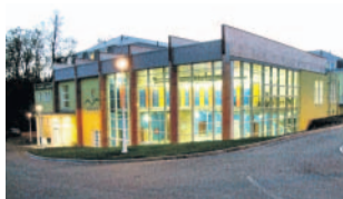
Novostavby Budova léčebných lázní Konstantinovy Lázně