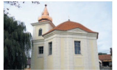
Rekonstrukce Kostel Ostrov u Stříbra