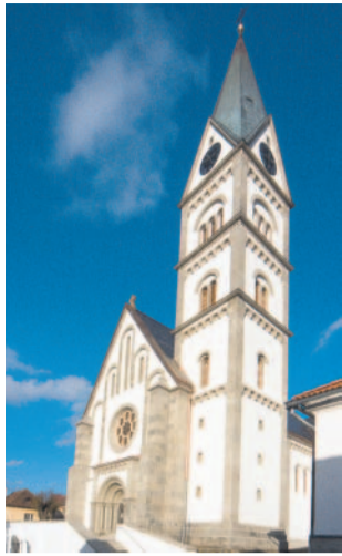
Rekonstrukce Kostel obec Žihobce