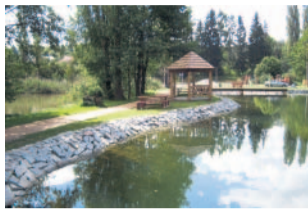
Sport a volný čas Koupaliště Plasy