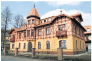
Rekonstrukce Dům klidného stáří Žinkovy