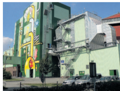
Inženýrské stavby Kotelna na biomasu Plzeňské teplárenské Plzeň