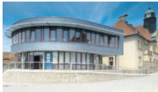
Novostavby Radnice Holýšov