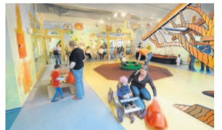
Sport a volný čas Dům pohádek Plzeň