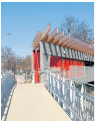
Veřejná prostranství Tylovo nábreží Klatovy