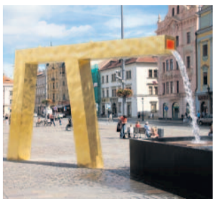
Veřejná prostranství Kašny na nám. Republiky Plzeň