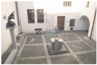
Sport a volný čas Dvorek Klatovy