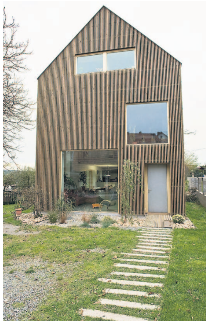
Novostavby Rodinný dům Česká Bříza