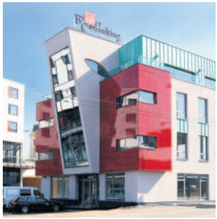
Novostavby Administrativní budova u Hamburku Plzeň