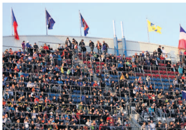
Fandíme Na přátelský zápas reprezentace do 21 let Česka s Francií se přišly na Androv stadion v Olomouci podívat stovky fanoušků.