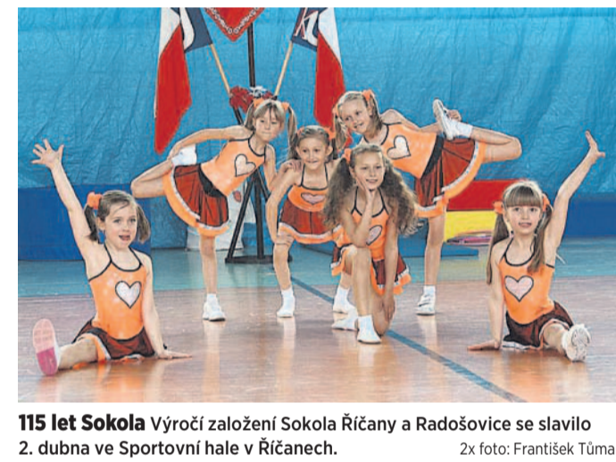
115 let Sokola. Výročí založení Sokola Říčany a Radošovice se slavilo 2. dubna ve Sportovní hale v Říčanech.