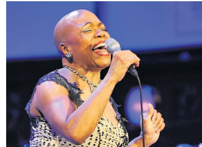
Jedna z nejuznávanějších vokalistek Dee Dee Bridgewater se představila v sobotu v Obecním domě. Program byl sestaven ve prospěch festivalu Struny podzimem.

Výběr z fotoalb čtenářů na serveru rajce.net