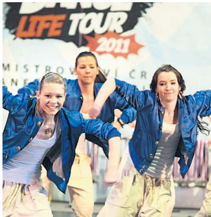
Místní špička V Olomouci tančili Lola's Dance, Duck Beat nebo All Style Unit.