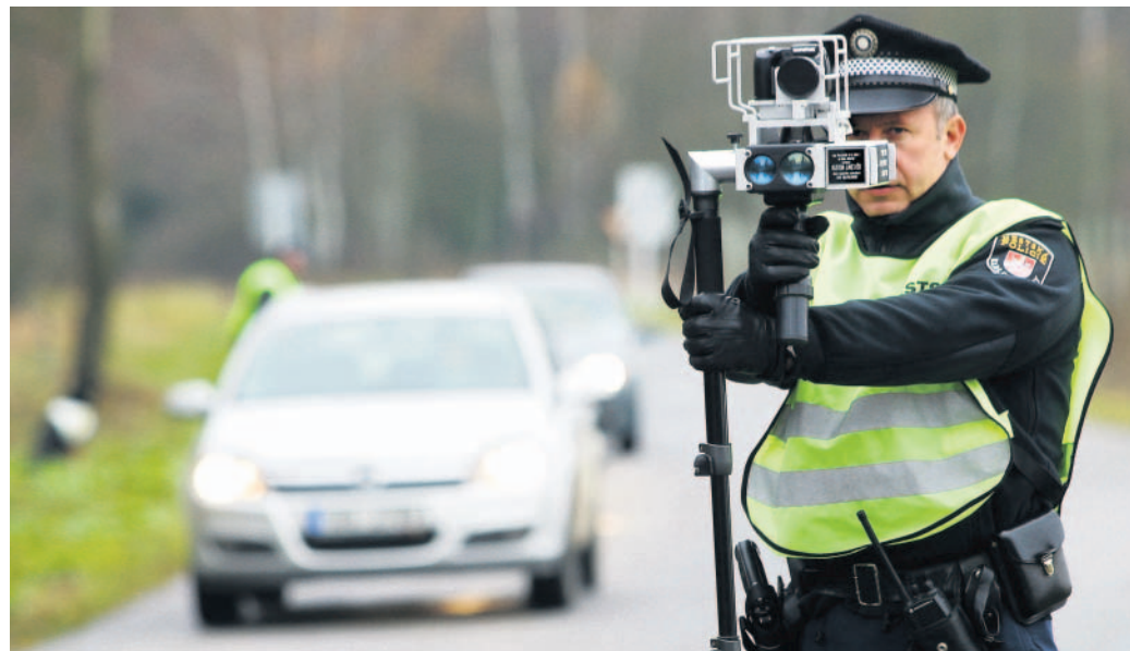
Nezbytní strážníci Měřit rychlost mají podle ministerstva strážníci nebo policisté.

spíšil však vysvětlil, že nic moc se měnit nebude. „Ministerstvo nám vytýkalo, že by například mohlo dojít k úniku osobních dat. Proto jsme odborníkům z ministerstva přesně popsali, jak celý systém funguje. Některé záležitosti správného řízení jim nebyly jasné, tak jsme je podrobně vysvětlili. Nic zásadního se měnit nebude,“ řekl Pospíšil.