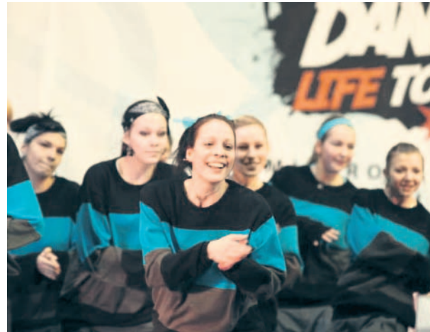
Slet tanečnic Desítky tanečních skupin z Olomouckého a Zlínského kraje zápolila v olomoucké Hale UP. Účastnili se regionálního kola největší taneční přehlídky v Česku.