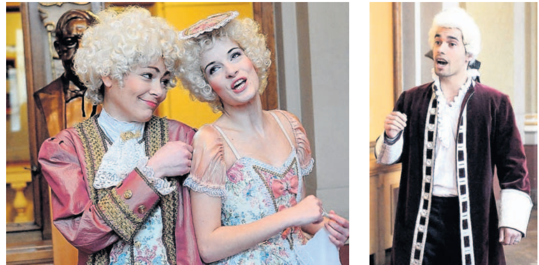
Bastien a Bastienka Mozartova miniopera sklídila u malých diváků úspěch. Divadlo plánuje reprízy.