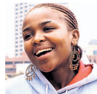
Thembi O své nemoci před světem nemlčela.

Hlavní postava jihoafrického snímku Thembi, který uvádí kino Beseda ve 20.30 hodin, už nežije. V 16 letech onemocněla AIDS a o 8 let později své nemoci podlehl. Tato africká dívka však rozhodně na svůj osud nerezignovala. S nezodolnou energií, bezprostředností, smyslem pro humor a hlavně vůlí pokusit se prolomit hradbu mlčení, která v její zemi obklopuje přes pět milionů lidí diagnostikovaných jako HIV pozitivní, se svým příběhem seznámila desetkrát více lidí. V rámci „přednáškového turné“ o životě s AIDS objížděla školy, setkala se s americkým prezidentem, přednášela v parlamentu a díky veřejnoprávním rádiím v USA, Velké Británii, Kanadě a Austrálii slyšelo její příběh 50 milionů posluchačů. Portrétem naprosto otevřeně a obdivuhodně energické dívky, která navzdory své nemoci měla přtele a dítě, jeden den Jednoho světa končí. Zítra začíná další.