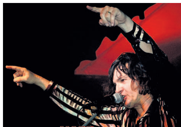
Hard rock V Pěnčíně u Turnova se uskutečnil koncert slovenské Tublatanky, kterou doprovodil Judas Priest Revival.

Vášim objektivem MF DNES přináší snímky čtenářů z internetového fotoalba rajce.idnes.cz . Dnes jde o záběry z vikendového koncertu Tublatanky v Pěnčíně u Turnova