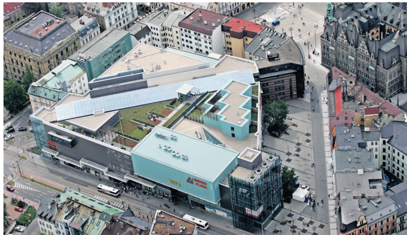
Obchodní domy místo výhledu do krajiny „Kvůli novým hmotám obchodních domů Plaza a Forum byly zakryty významné průhledy směrem k Ještědu na Šaldově náměstí, respektive v Pražské ulici,“ zmiňuje Filip Landa ve svém textu jeden z problémů. Na snímku je Plaza.

Následná praxe ukazuje zřetelnost absence tolik důležitého ele-