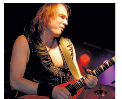
Slovenská rocková legenda Tublatanka obžijí koncertní sály také u příležitosti nedávno vydaného nového DVD s názvem: 25 rockov live.