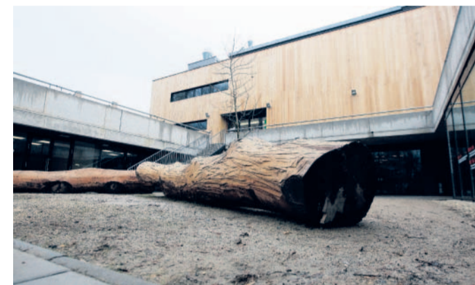
Nové kulturní centrum Ve Vratislavicích otevřeli kulturní centrum minulý rok na podzim. Od té doby se tu konají kulturní akce, ale například také cvičení či cestopisné přednášky. Svoje místo tady našel také památník slavného místního rodáka, konstruktéra Ferdinanda Porscheho.