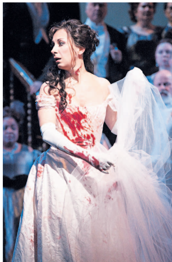
Šílenství Natalie Dessay v Lucii di Lammermoor.

Děj Lucii di Lammermoor se odehrává v pochmurném Skotsku. To jen podtrhuje „gotickou“ náladu příběhu o nešťastné Lucii, která je donucena, aby se provdala za nemilovaného muže. Téměř shakespearovské pozadí děje o nepřátelství dvou rodů a rozporu mezi sourozeneckou a mileneckou láskou zaručuje věrohodně vybudovaný dramatický konflikt. „Lucia není jen operou „krásného zpěvu“ čili bel canta. Je to také drama par excellence. Slavná scéna Lucina šílenství je pak učebnicovým příkladem, ve kterém se snoubí jak pěvecké, tak herecké umění interpretky titulní role. Natalie Dessay debutovala v této roli v Metropolitní opeře v roce 2007 a byl to debut vskutku famózní,“ uvádí organizátor. Jeho slova dokládá americká operní kritika, jež psala o „mistrovské lekci skvostného zpěvu a výsostného herectví“. Přímý přenos v královéhradeckém arkině Centrální začíná už v 17.45 hodin.