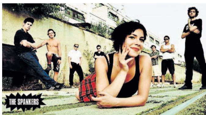
The Spankers Energická reggae, disco-popová kapela z Prahy, vystoupí dnes v Hronově na festivalu Music for Tibet.

Cizinec 17.00, 19.30 Rtyně v Podkrkonoší DIGITÁLNÍ KINO Rtyně v Podkrkonoší Lucky Luke na Divokém západě 18.00 Rychov nad Kněžnou KINO Hrdinů Odboje 671, tel. 494 534 505 Zelený sršeň 20.00 Smiřice KD DVORANA Palackého 124, tel. 495 422 090 Velikonoční pohádka aneb O jaru Pohádka na motivy lidových zvuků a obyčejů. 9.00, 10.00 Teplice nad Metují KINO Teplice nad Metují, tel. 491 581 197 Aut Klárka je dospělá autistka, která žije se svými rodiči, ale hlavně ve svém světě a se svými rituály. Všichni kolem ní se jí snaží přizpůsobit. Po letech si ale začíná uvědomovat, jak se změnil vztahy mezi nimi navzájem. V době, kdy už někteří ztrácejí sílu o Klárku pečovat, přichází spásná záchrana - stane se „zárazk“. Vstupné: 100,- 19.00 Trutnov KINO VESMÍR Revoluční 20, tel. 499 815 717 Hon na čarodějnice 17.30 Rango 15.30 NÁRODNÍ DŮM Národní 199, tel. 499 840 080 Horkýže slíže + Cocotte Minute Vstupné: 250,- 19.00 Úpice DIVADLO A. JIRÁSKA Chelčického 216, tel. 499 882 197 A co láska, Orgasmus bez předsudků Dvě originální aktovy. Vstupné: 90,- 19.30