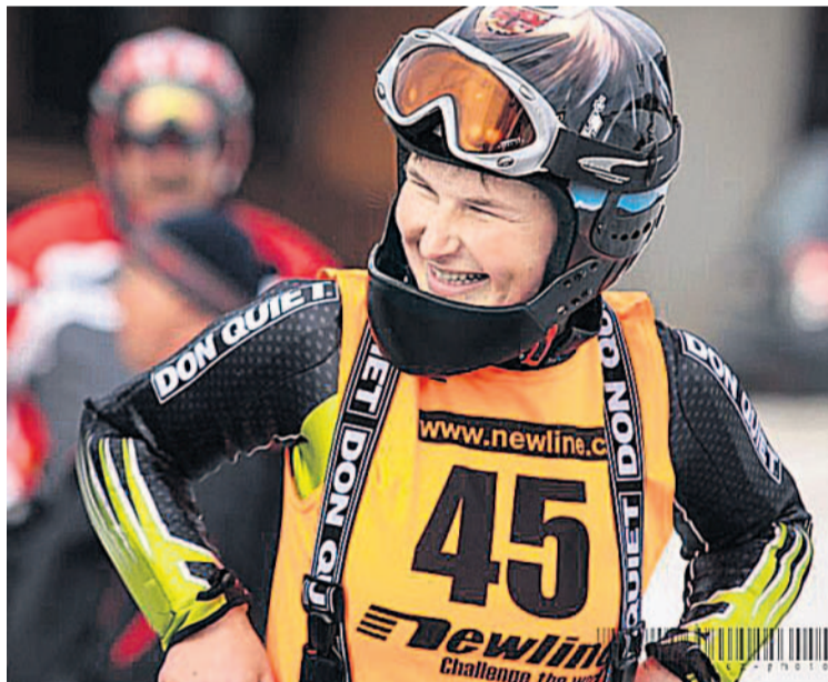
Zimní úsměv Lyžaři si mohli na sjezdovce vyzkoušet obří slalom.