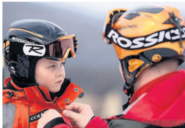
Zapni si bundu... Ski areál Hlubočky u Olomouce přivítal o víkendu pátý ročník Olomouckého Kaprunu cupu.

Děni v Olomouckém kraji na vašich snímcích. Dnes záběry Ivo Kotase z lyžování v Hlubočkách