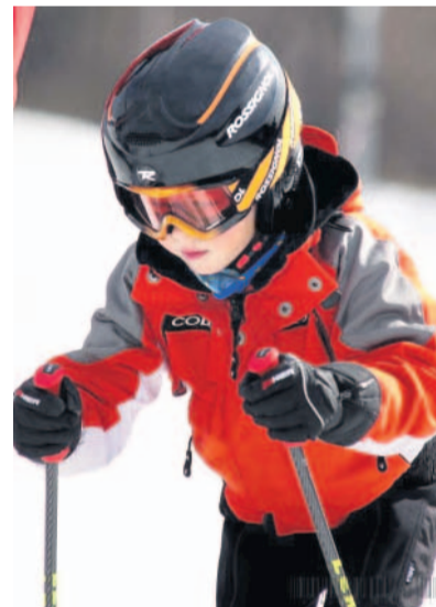
V Hlubočkách si mohly zázavodit i děti.

Na stránce www.rajce.net si založte zadarmo účet. Další návody najdete na www.navody.rajce.net .